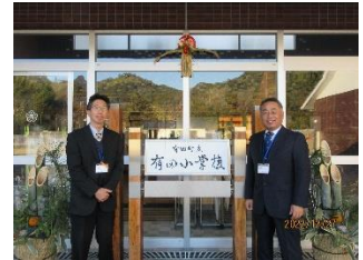
学校の門松をバックに