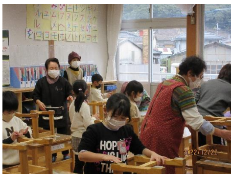
綺麗に片付いた教室