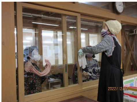
透けたように見える窓ガラス

終業式の後、全職員で廊下のワックスがけ作業を行い、新たな年を迎えることができました。