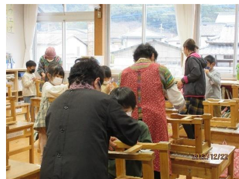
埃をガムテープでとった椅子